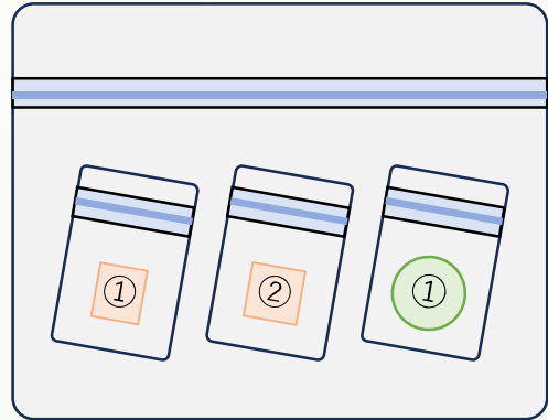
複数の建材から採取した試料が混在