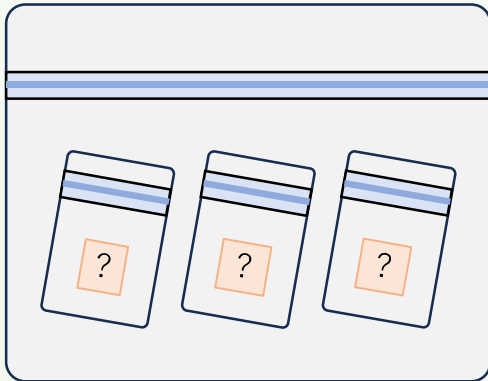
試料を識別できる情報の記載がない