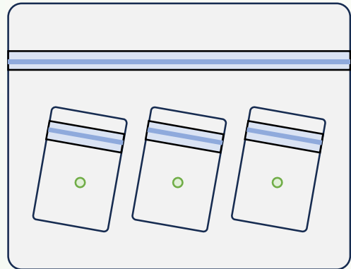
試料が極端に小さい（量が少ない）